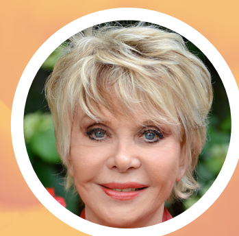
Avec la participation exceptionnelle de Sophie Darel Actrice et auteure