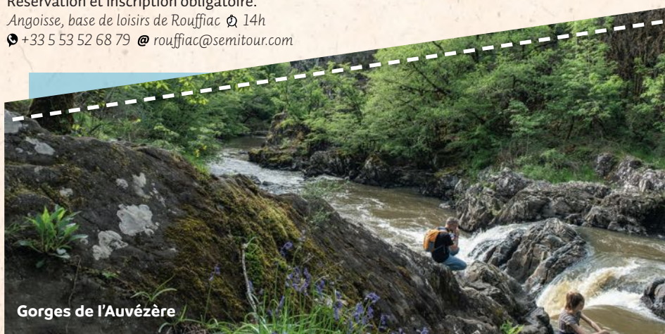
Gorges de l'Auvézère