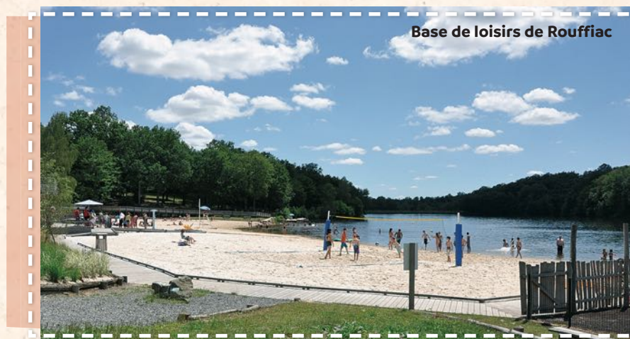
Base de loisirs de Rouffiac